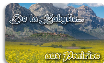
Le retour de la vie