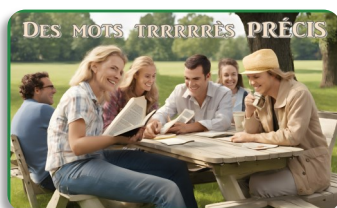
Enchifrener et lantiponner