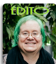
La vie reprend ses droits