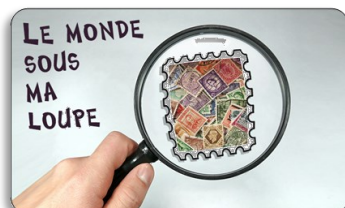
Les timbres de l'île Maurice