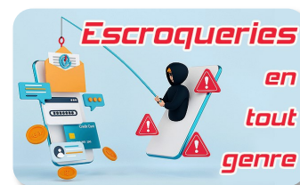
Quand l'intelligence artificielle devient...