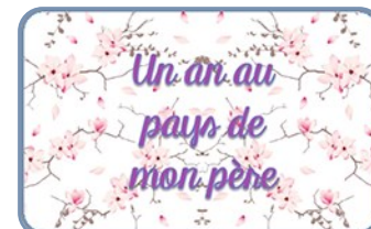
Hiroshima et Miyajima, déménagement et Sky Tree