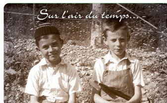
Sur l'air du temps