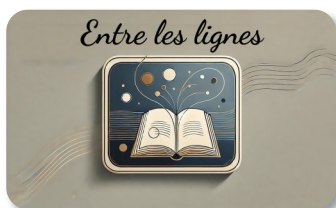
Une disposition pour la création et l'imagination